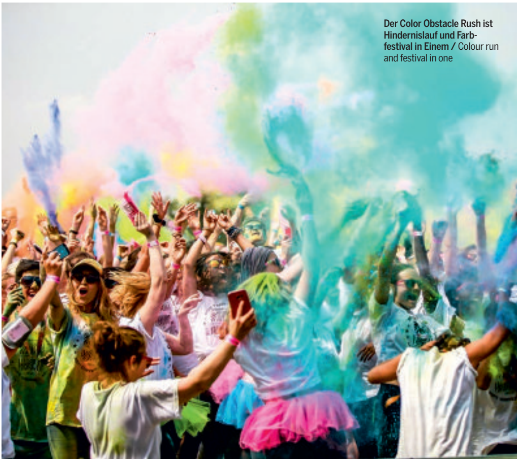
Der Color Obstacle Rush ist Hindernislauf und Farbfestival in Einem / Colour run and festival in one